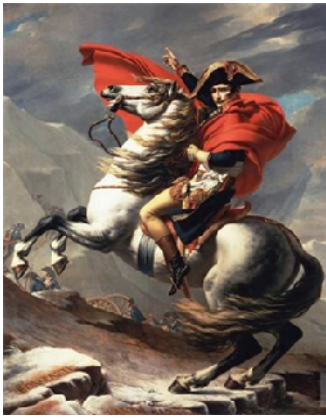
David, Napoléon traversant le Grand Saint Bernard , 1801