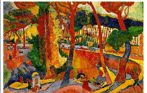
André DERAINE, L'Estaque, route tournante , 1906