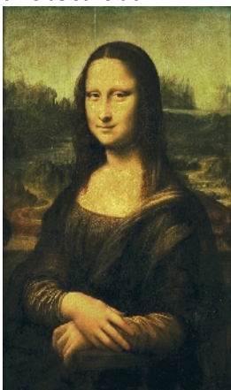
Léonard de Vinci, La Joconde , entre 1503 & 1506