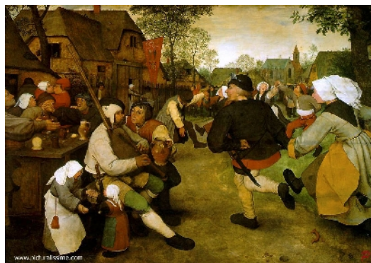
Bruegel, Danse de paysans , 1568