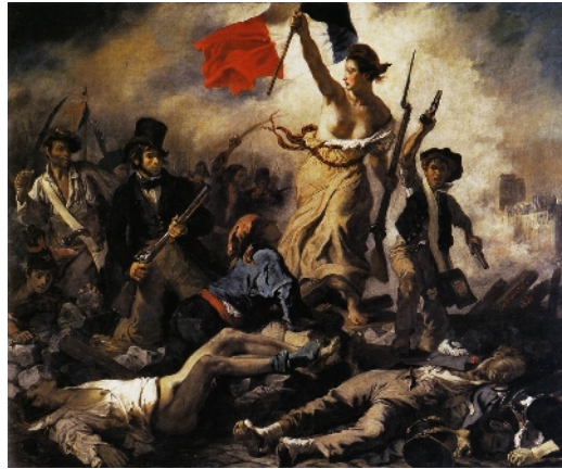
Delacroix, Le 28 Juillet. La Liberté guidant le peuple , 1830